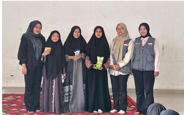
Gambar 4 - Foto bersama peserta tanya jawab

Sebagai tindak lanjut dari kegiatan sosialisasi tersebut diperlukan strategi untuk memperkuat efek positif kegiatan ini. Salah satunya adalah pelibatan pengurus yayasan dan tokoh pemuda sebagai fasilitator agar keberlanjutan program dapat terjaga. Selain itu, penggunaan media pembelajaran yang lebih kreatif dan variatif, misalnya video pendek atau poster edukatif, dapat membantu menarik minat remaja dan memperkuat pemahaman mereka. Kolaborasi dengan sekolah dan lembaga terkait juga disarankan agar dampak kegiatan dapat menjangkau lebih banyak kelompok sasaran.