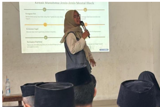
Gambar 5 - Penyampaian materi

Dengan demikian, kegiatan ini tidak hanya berfungsi sebagai intervensi sesaat, tetapi juga dapat menjadi model pemberdayaan remaja yang berkelanjutan. Jika dilakukan secara konsisten, pendekatan ini berpotensi menumbuhkan generasi muda yang lebih tangguh, kritis, dan mampu menjaga diri dari ancaman narkoba maupun hambatan psikologis internal.