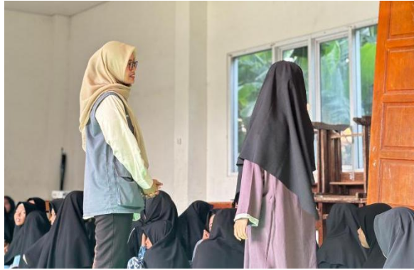
Gambar 2 - Sesi tanya jawab Peserta