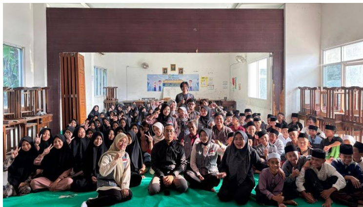
Gambar 3 - Foto Bersama seluruh Peserta

Dari hasil evaluasi, sebagian besar peserta mengungkapkan bahwa mereka merasa lebih siap menghadapi tantangan psikologis internal seperti mental block dan lebih waspada terhadap pengaruh negatif narkoba di lingkungan sekitar. Beberapa pengurus yayasan juga menyatakan minat untuk mengintegrasikan materi serupa dalam kegiatan rutin mereka, meski dengan pendekatan sederhana dan sesuai kapasitas.